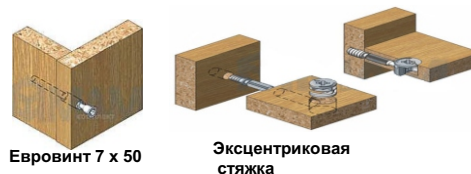
Евровинт 7 x 50